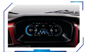
Full LCD panel instrument cluster