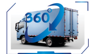
360° panoramic system