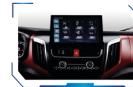
12.3" large stereoscopic centre screen