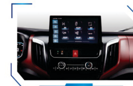
12.3" large stereoscopic centre screen