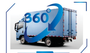
360° panoramic system