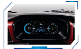
Full LCD panel instrument cluster