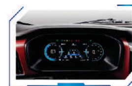
Full LCD panel instrument cluster