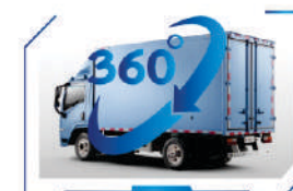
360° panoramic system