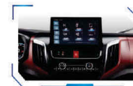
12.3" large stereoscopic centre screen